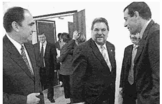
Commemoran los 25 años de las APA cristianas

el alcalde de Lleida, Antoni Siurana. El paer en cap hizo un llamamiento a las familias para mejorar la comunicación entre padres e hijos y afirmó que el problema de la educación "es un problema de toda la sociedad, y no sólo de la escuela".