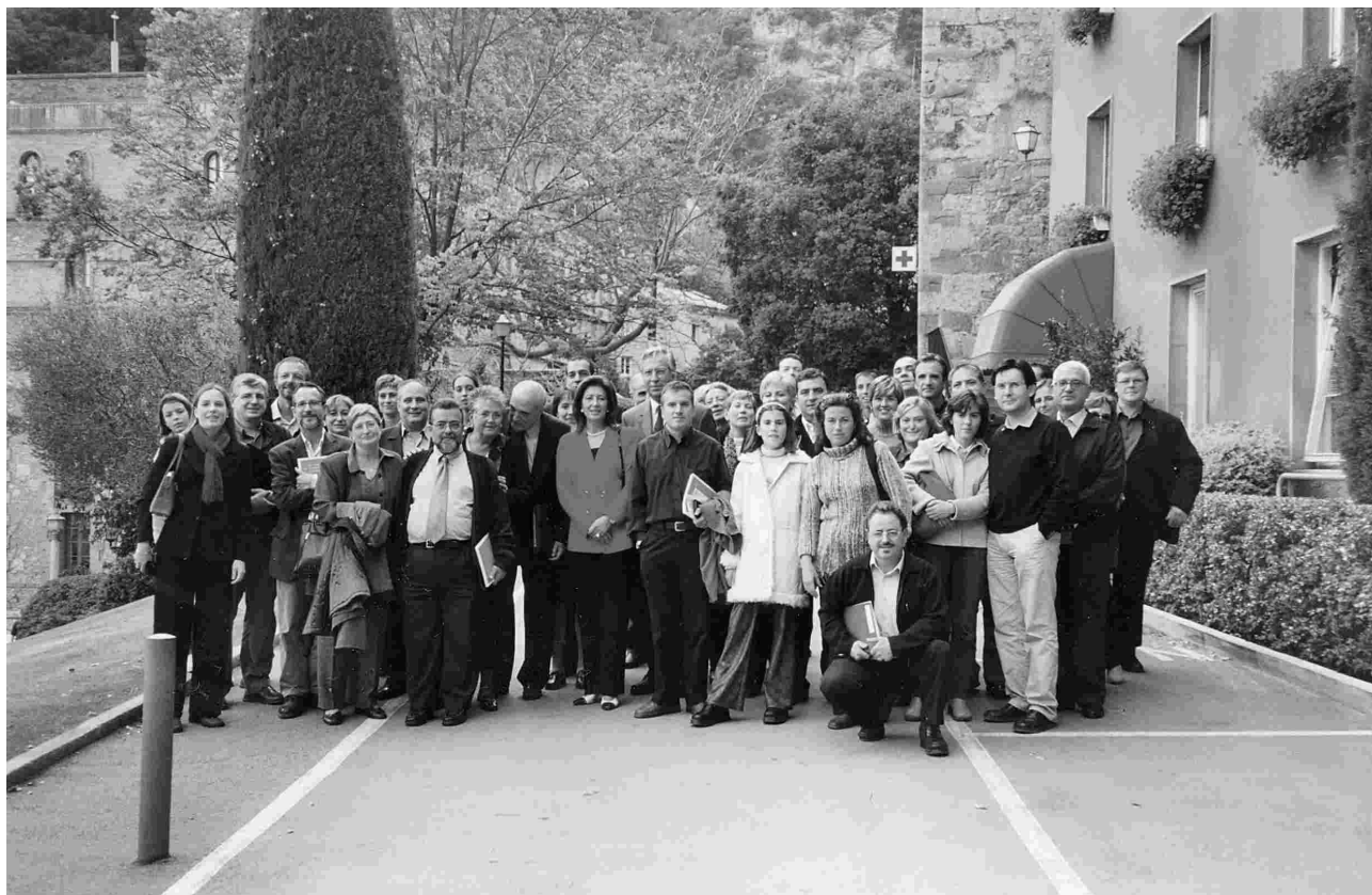
Participants de la celebració a Montserrat del 25è Aniversari de la Confederació

Continuant amb la notícia anterior, us avancem que durant aquest curs, a cada Federació es farà un Acte per a celebrar els 25 Anys de la Confederació, perquè tots puguem participar d'aquesta celebració, i aquí a Lleida serà cap a meitat de març, ja en sereu informats.